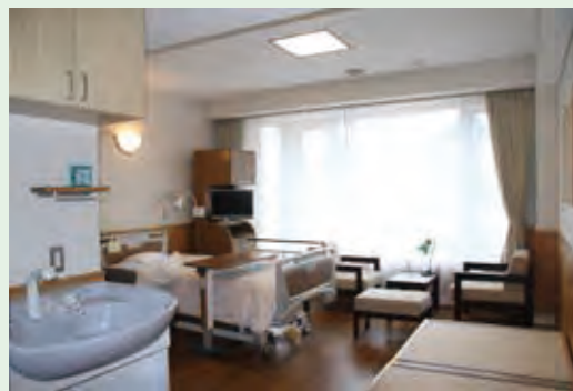
特別室 A (21.42㎡) 4室

お部屋は、全室トイレ付き個室となっており、ヒバ材の腰壁を施し、木の温もりと安らぎの空間を提供しています。 また、冷暖房、シャワー洗面台、テレビ、冷蔵庫、インターネット回線等を完備。 特別室には、応接セットまたはソファを設置。付き添われるご家族のために、簡易ベッドタイプになっています。