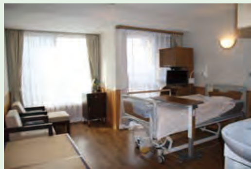
一般個室 (16.68㎡) 10室