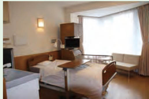
特別室 B (18.29㎡) 6室

お部屋は、全室トイレ付き個室となっており、ヒバ材の腰壁を施し、木の温もりと安らぎの空間を提供しています。 また、冷暖房、シャワー洗面台、テレビ、冷蔵庫、インターネット回線等を完備。 特別室には、応接セットまたはソファを設置。付き添われるご家族のために、簡易ベッドタイプになっています。